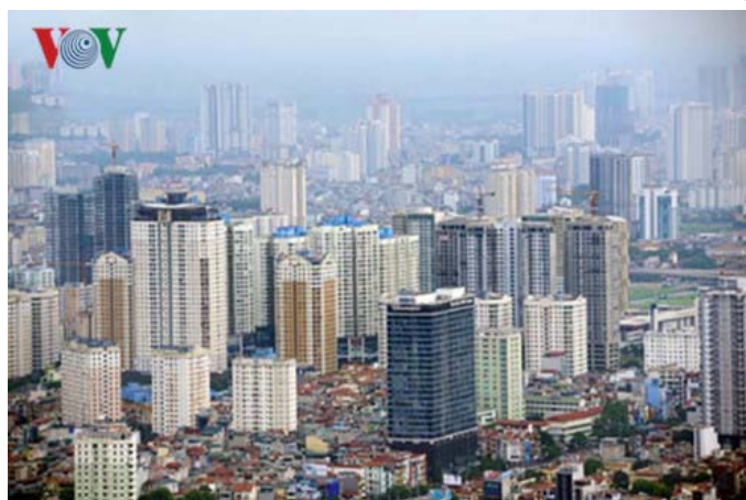
Quá trình phát triển đô thị đang ảnh hưởng đến môi trường tự nhiên, văn hóa.

Hội thảo xoay quanh vấn đề phát triển đô thị dưới tác động của biến đổi khí hậu và tập trung vào các nội dung như giảm nhẹ rủi ro bởi lũ lụt, vai trò của việc xanh hóa đô thị, các yêu cầu đối với nhà ở liên quan tới sự thích ứng với khí hậu cũng như năng đáp ứng nhu cầu sử dụng nước, quy hoạch đô thị, kiến trúc cảnh quan và năng lượng bền vững.